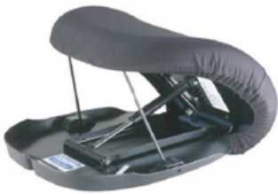
COM ALMOFADA DE CONFORTO