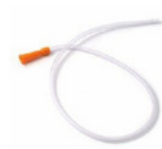
Sonda Levin Silicone CH12 a 18 - 9,40€ + IVA 6%

OFERTA ENTREGA EM TODAS AS ENCOMENDAS 5% de DESCONTOS NO RESTANTE CATALOGO PARA ASSOCIADOS UDIPSS