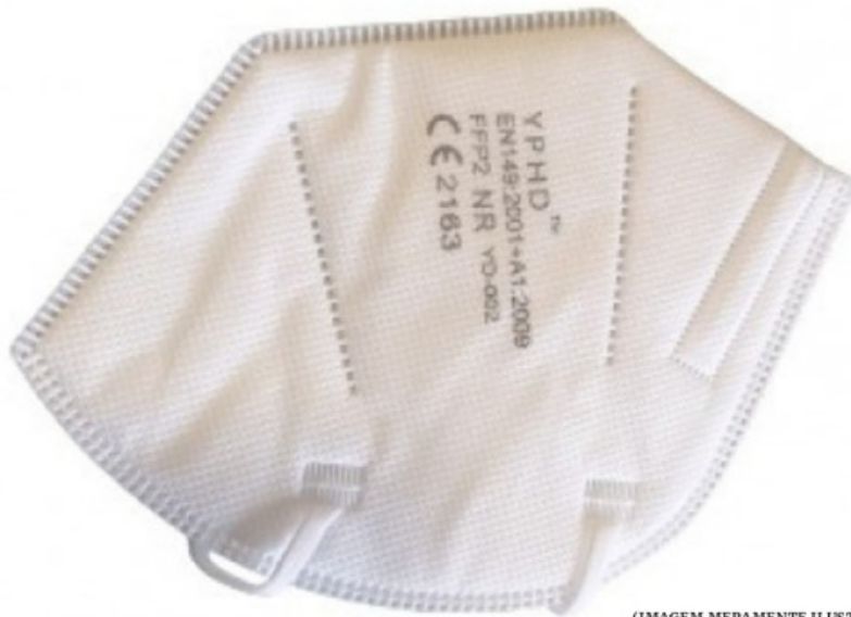
(IMAGEM MERAMENTE ILUSTRATIVA)

NA COMPRA DE 125€+IVA OFERTA DE 1 CAIXA DE 30 MÁSCARAS FFP2.