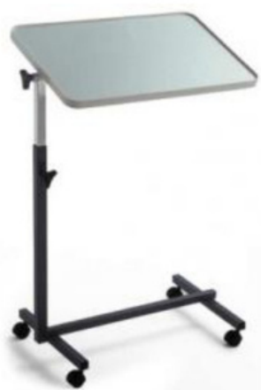
MESA COMER NO LEITO – Unid. – 55,00€ + IVA 23%