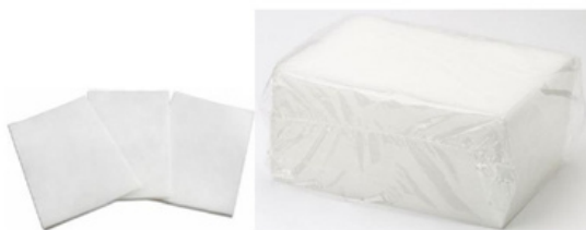
Esponjas não impregnadas - cx 1500 - 39,00€ + IVA 23%