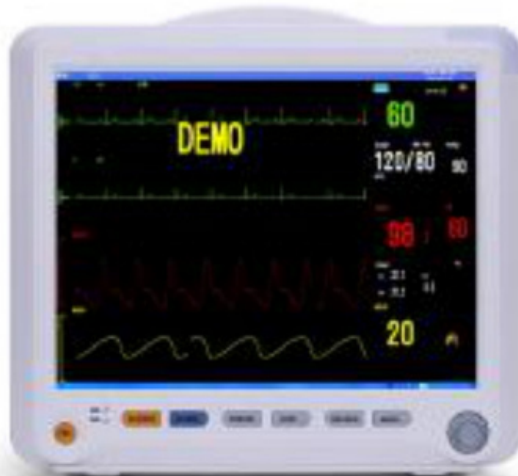
Monitor Multi-parâmetro YK-8000B