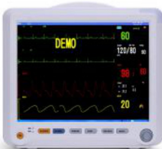
Monitor Multi-parâmetro YK-8000B