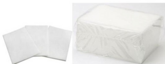
Espojas não impregnadas – cx 1500 - 39,00€ + IVA 23%