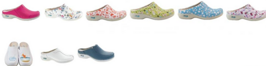
SOCAS HOSPITALARES WASH'GO : Vários modelos : a partir de 32,00€

Descontos de Quantidade para associados UDIPSS