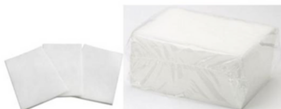
Espojas não impregnadas – cx 1500 - 39,00€ + IVA 23%