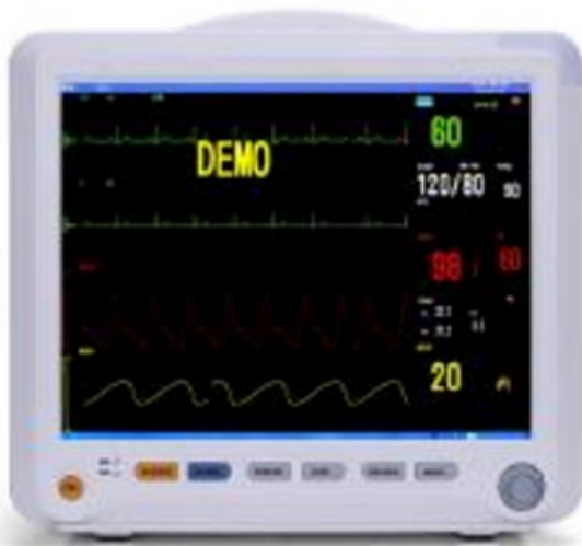
Monitor Multi-parâmetro YK-8000B