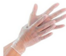
Luvas Vinil s/ pó – cx 100 ( S,M,L) – 2,90€ + IVA 23%