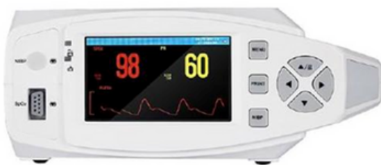
Monitor Multi-parâmetro 4.3