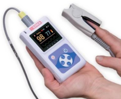
OXIMETRO OXY-50 – Unid. – 163,80€ + IVA 6%