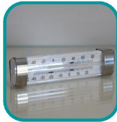
TERMÓMETRO ESPECIAL FRIO