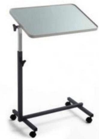
MESA COMER NO LEITO – Unid. – 55,00€ + IVA 23%