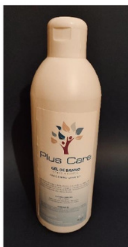
Gel Banho c/ Glicerina PLUS CARE – 1,20€ + IVA ( enc. Minima 12 unidades) (Certificado pelo INFARMED)

OFERTA ENTREGA EM TODAS AS ENCOMENDAS 5% de DESCONTOS NO RESTANTE CATALOGO PARA ASSOCIADOS UDIPSS