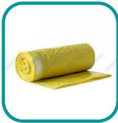
ROLO SACO LIXO AMARELO 30L

Válida somente para associados UDIPSS Ofertas não acumuláveis entre si