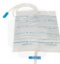
Saco Coletor Urina 2L c/ Torneira- 0,50€ + IVA 6%