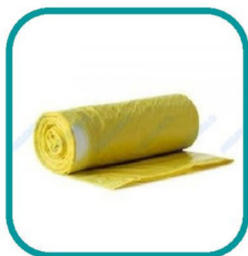
ROLO SACO LIXO AMARELO 30L

Válida somente para associados UDIPSS Ofertas não acumuláveis entre si